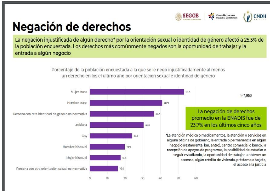
7 Encuesta sobre Discriminación por Motivos de Orientación Sexual e Identidad de Género 2018

“2022. Año del Quincentenario de la Fundación de Toluca de Lerdo, Capital del Estado de México”